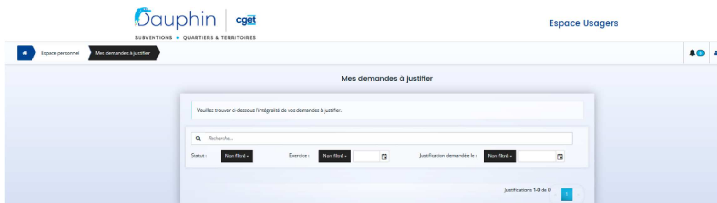
Figure 2 : interface des demandes à justifier

Avec l'interface proposée ci-dessous, vous pouvez, filtrer les subventions à justifier sur le nom de la demande, son statut (en instruction, mise en paiement, payée, etc.) ou l'exercice budgétaire.