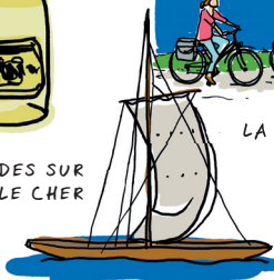
LES BALADES SUR LA LOIRE ET LE CHER