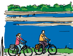
LA LOIRE À VÉLO