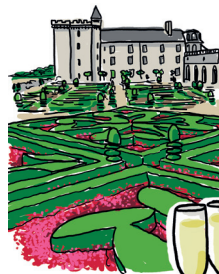
LE CHÂTEAU DE VILLANDRY ET SES JARDINS