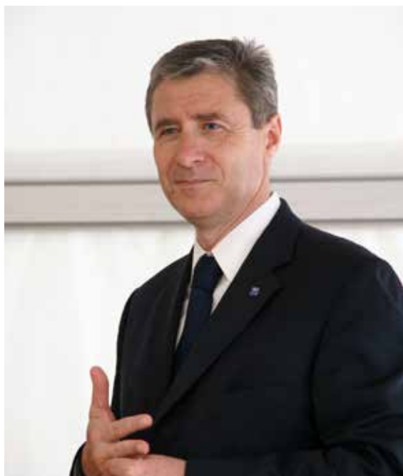
PHILIPPE BRIAND Président de Tours Métropole Val de Loire