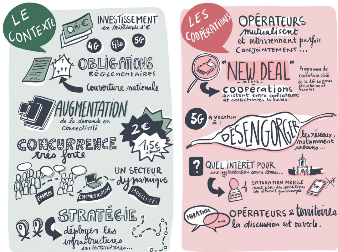
Extraits des facilitations graphiques produites dans le cadre de la Mission 5G Ville de Rennes Auteure : Mission 5G Ville de Rennes