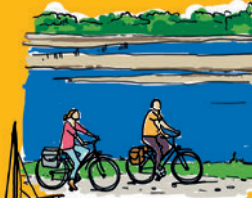
LA LOIRE À VÉLO