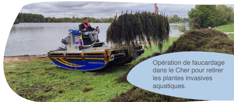
Opération de faucardage dans le Cher pour retirer les plantes invasives aquatiques.

Afin d'éviter, lors du nettoyage des barrages, le rejet de matières exogènes au Cher et ainsi éviter la perturbation locale de son écosystème, Tours Métropole Val de Loire a décidé d'expérimenter une nouvelle technique : le nettoyage cryogénique. Cette technique remplace le sable par des granules de glace carbonique, issues du recyclage. Le choc thermique et mécanique provoqué par la glace permet aux impuretés qui se sont déposées de se désolidariser.