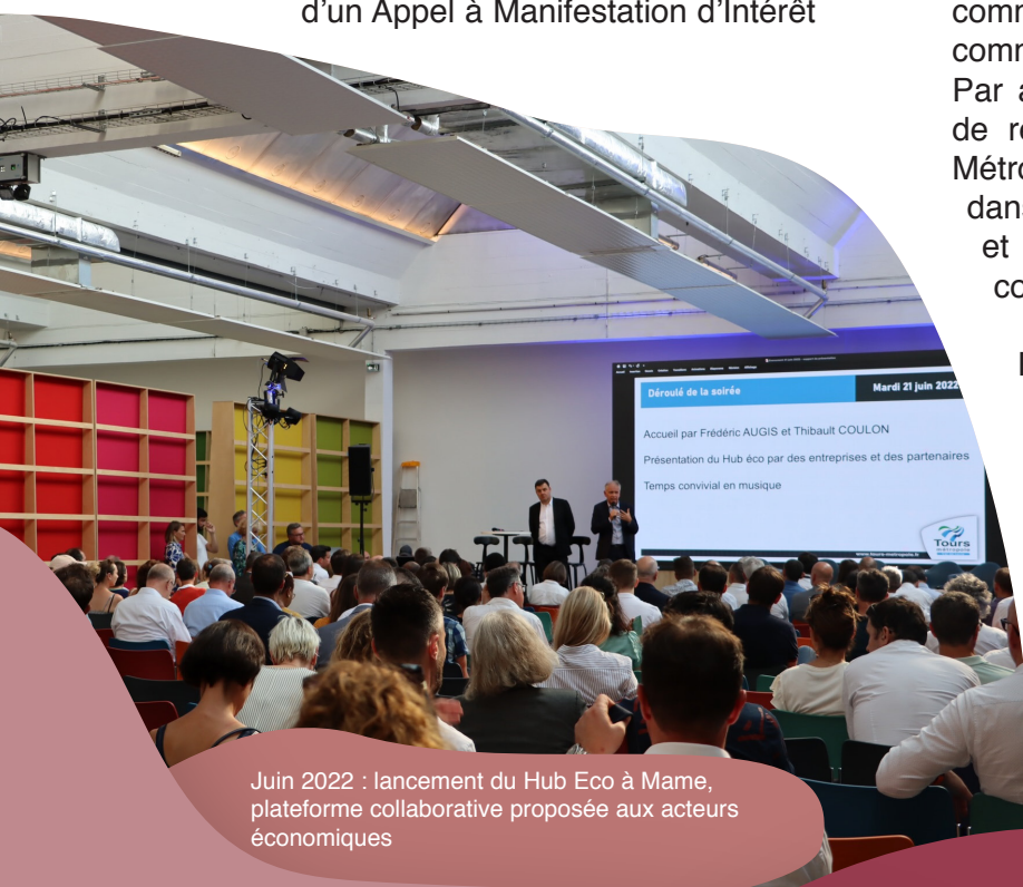
Juin 2022 : lancement du Hub Eco à Mame, plateforme collaborative proposée aux acteurs économiques

Par ailleurs et afin de limiter l'augmentation du volume et de la fréquence des tournées en ville liées notamment à l'essor du e-commerce et du circuit de seconde main, une convention de partenariat sur les 5 prochaines années (2023-2027) entre la Ville de Tours, le Syndicat des Mobilités de Touraine, le groupe La Poste et Tours Métropole Val de Loire, devrait être signée début 2023.