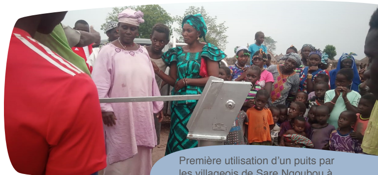
Première utilisation d'un puits par les villageois de Sare Ngoubou à Koussanar - Sénégal

Comme tous les ans, des puits équipés de pompes à motricité humaine sont installés dans les villages les plus reculés de cette commune avec l'aide technique et financière de la Métropole. En 2022, 2 villages ont pu bénéficier de ces nouveaux équipements : Sare Ngaye Samba et Sare Toumou. C'est une population d'environ 500 habitants supplémentaires qui peut bénéficier d'une eau de qualité à proximité de leurs habitations.