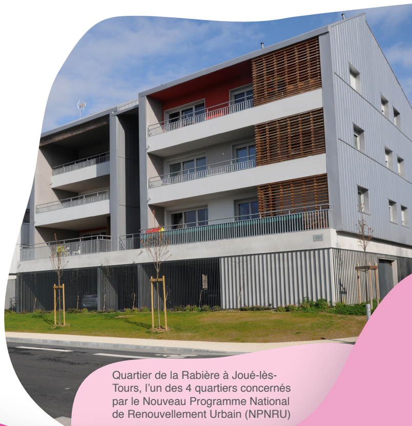
Quartier de la Rabière à Joué-lès-Tours, l'un des 4 quartiers concernés par le Nouveau Programme National de Renouvellement Urbain (NPNRU)

Intégrée à la protection de l'enfance, la mission de prévention spécialisée est aujourd'hui une compétence métropolitaine, déléguée par le Conseil Départemental. Son objectif est d'intervenir auprès des jeunes de 11 à 25 ans en proposant un cadre d'accompagnement éducatif et un soutien aux familles dans leur rôle parental. En 2022, les animateurs de La Gloriette ont accueilli des chantiers éducatifs autour des questions environnementales qui se sont avérés très bénéfiques pour les jeunes accompagnés, leur permettant ainsi de se confronter au milieu professionnel.