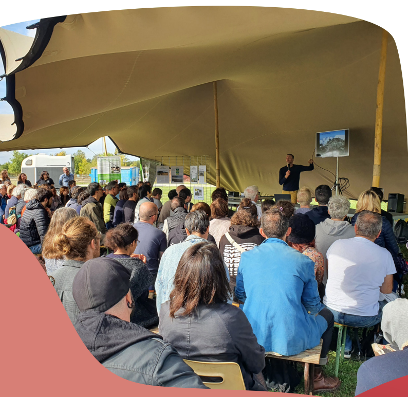
Conférence sous le «tipi géant» dans le cadre de l'événement «Place du Climat - spécial Biodiversité» au parc de La Gloriette

Annoncée par le Premier ministre fin 2021, la faculté d'odontologie de l'Université de Tours a été officiellement inaugurée le lundi 7 novembre 2022. Tenant compte des singularités territoriales et disciplinaires, elle a pour ambition d'augmenter le nombre de chirurgiens-dentistes et ainsi d'améliorer le maillage territorial en soins dentaires. Tours Métropole Val de Loire a soutenu financièrement ce projet.