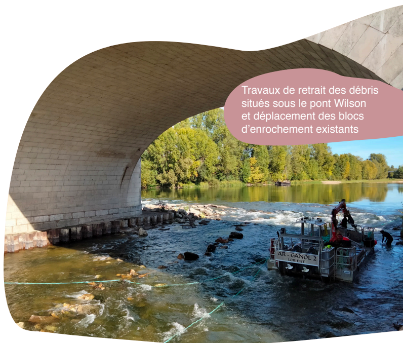
Travaux de retrait des débris situés sous le pont Wilson et déplacement des blocs d'enrochement existants

été lancé à l'automne 2022. L'opération permettrait à terme et après une phase d'observation et de test prévue en 2023, d'envisager le passage de bateaux transitionnels (à fond plat), de canoë et... de poissons !