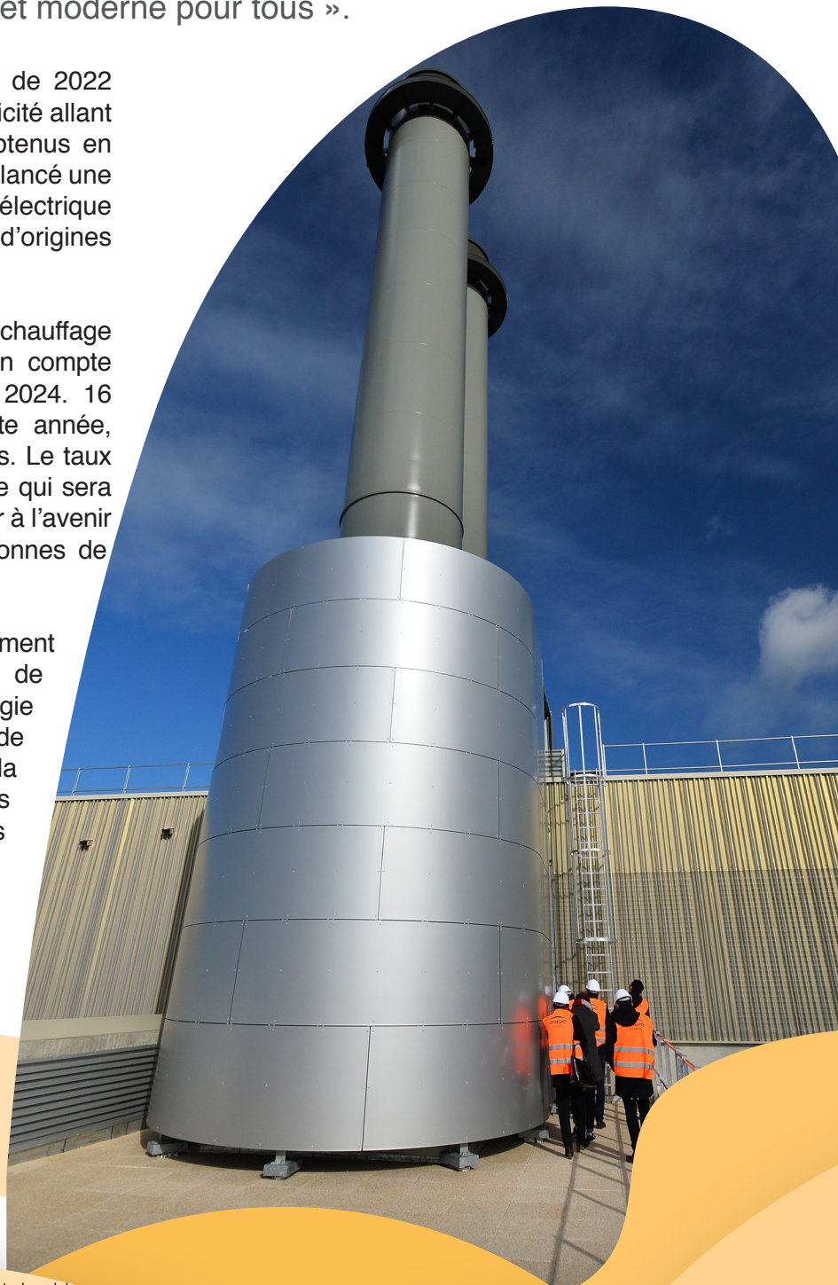
Chaudière biomasse du Menneton

Pour décarboner les transports, un groupement d'intérêt composé de Tours Métropole Val de Loire, du Syndicat Intercommunal d'Énergie d'Indre-et-Loire, de la Communauté de Commune Touraine Vallée de l'Indre, de la Communauté de Commune Sud Loches Touraine et de l'entreprise ST Microelectronics s'est constitué, et ce dans l'objectif de développer une filière hydrogène. En 2021, il a répondu à l'Appel à Projets « Ecosystèmes hydrogène territoriaux » lancé par l'ADEME et en a été désigné lauréat en 2022.