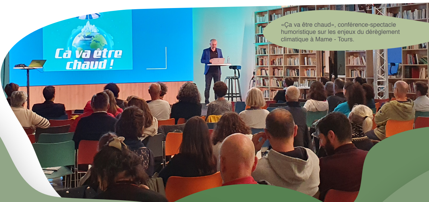
«Ça va être chaud», conférence-spectacle humoristique sur les enjeux du dérèglement climatique à Mame - Tours.

Prochaine étape pour le Plan Climat : la définition de la stratégie au premier trimestre 2023 et du plan d'action d'ici l'automne, en association avec les 300 personnes membres des 8 panels de concertation.