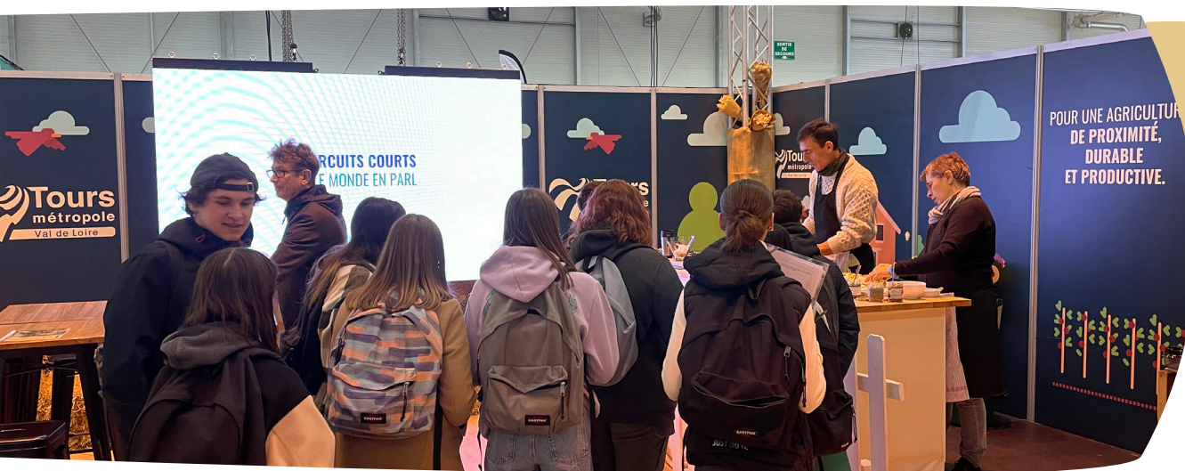
Stand de Tours Métropole au salon Ferme Expo - novembre 2022.

Enfin, dans le cadre de la manifestation « Place du Climat » organisée par la Métropole à La Gloriette le 16 octobre 2022, se déroulait le traditionnel repas éco-solidaire à base de produits frais, de saison et locaux - dont la recette a été, comme chaque année, reversée à la Banque Alimentaire de Touraine.