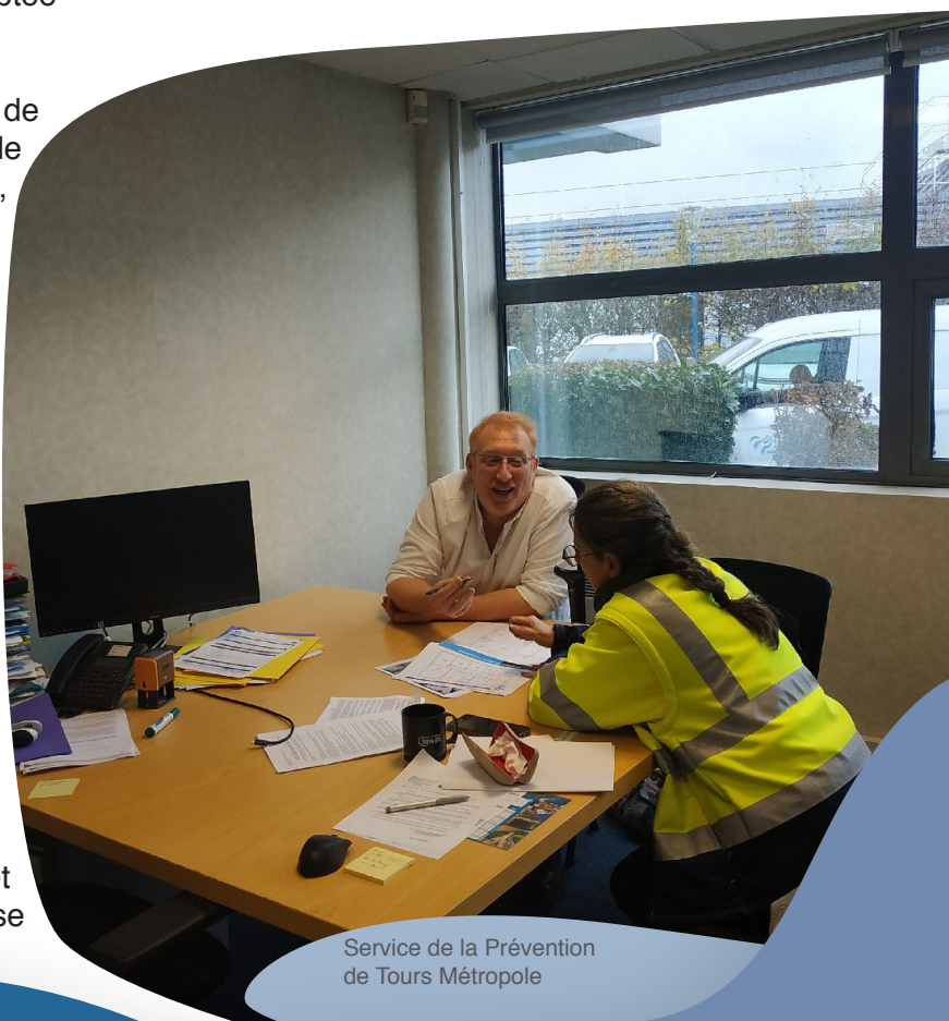
Service de la Prévention de Tours Métropole

L'action visant à accompagner les agents en inaptitude a également été mise en œuvre. A cet effet, un comité de maintien dans l'emploi se réunit toutes les 6 semaines. Composé d'une équipe pluridisciplinaire, il évalue les possibilités de maintien dans l'emploi sur le poste occupé ou sur un autre poste dans le cadre d'un reclassement pour les agents reconnus inaptes. Dans le cadre de la « Semaine pour l'emploi des personnes handicapées » qui s'est déroulée en novembre 2022, la Métropole a participé au « Duo Day ». Le concept : une personne en situation de handicap compose un duo avec un agent, pour une immersion dans son quotidien professionnel, en présentiel.