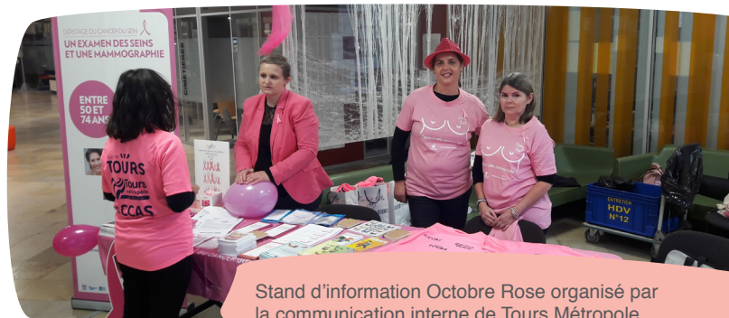
Stand d'information Octobre Rose organisé par la communication interne de Tours Métropole

et les hommes. Dans les actions retenues au titre de l'appel à projets 2022 du Contrat de Ville, la Métropole cofinance la formation des porteurs de projets des quartiers prioritaires afin d'intégrer dans leurs missions cet enjeu. Un soutien financier est également apporté aux associations sportives pour les femmes issues des quartiers prioritaires (rugby, tennis de table, course à pied, basket) dans le but de les remobiliser vers un parcours professionnel.