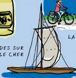
LES BALADES SUR LA LOIRE ET LE CHER