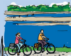
LA LOIRE À VÉLO