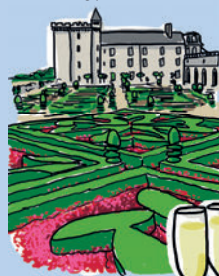
LE CHÂTEAU DE VILLANDRY ET SES JARDINS