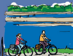
LA LOIRE À VÉLO