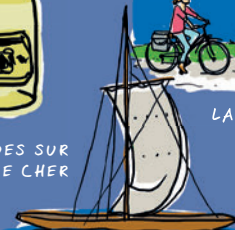
LES BALADES SUR LA LOIRE ET LE CHER