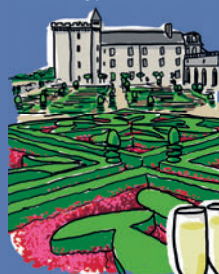
LE CHÂTEAU DE VILLANDRY ET SES JARDINS